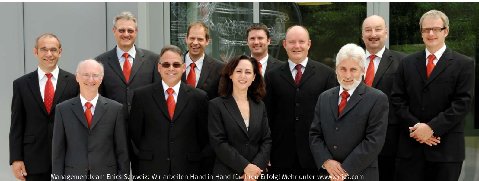
Managementteam Enics Schweiz: Wir arbeiten Hand in Hand für Ihren Erfolg! Mehr unter www.enics.com

Enics Schweiz ist Ihr Top-Technologiepartner für Industrie-Elektronik und Medizinaltechnik. Wir bieten umfassende und weltweit vernetzte Lösungen in den Bereichen Engineering, Manufacturing und After Sales. Damit liefern wir Ihnen eine einzige Schnittstelle für lokale und globale Bedürfnisse.